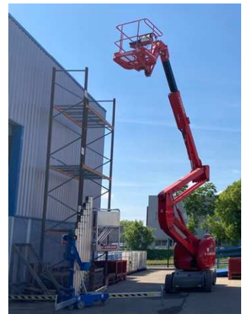
Nacelles groupes A et B

Les pré-requis devront être validés par le participant ou l'employeur en nous retournant la fiche d'inscription complétée.